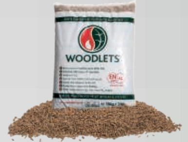
SAC DE PELLETS