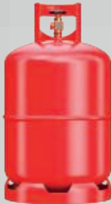
BOUTEILLE DE GAZ PROPANE